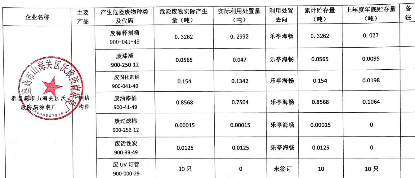
秦皇岛市危险废物产生单位信息公开模板（2021 年 1-12 月）

注：1. 可依据企业实际生产情况、工艺特点适当调整表格或增加文字描述。 2. 需要加盖企业公章。