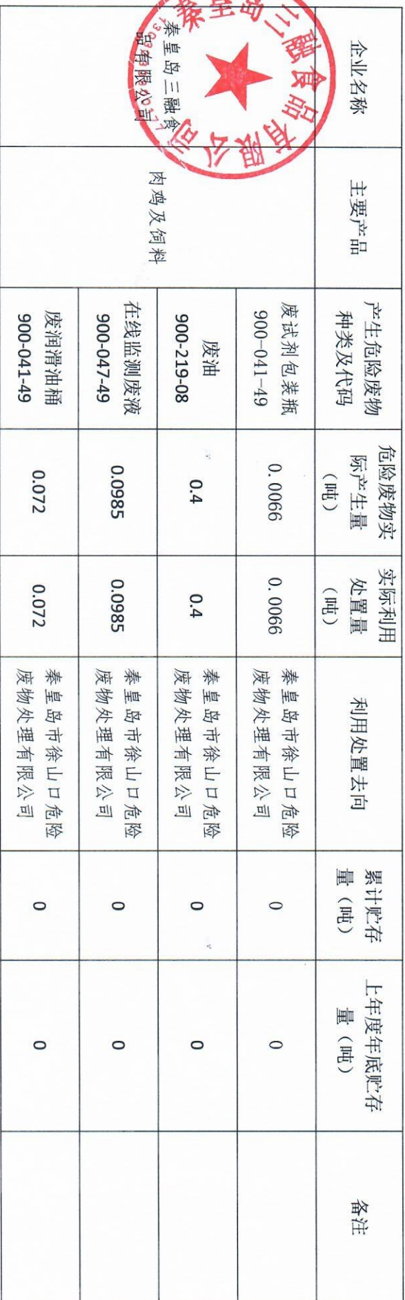
秦皇岛市危险废物产生单位信息公开模板（2021 年 1-12 月）

注：1. 可依据企业实际生产情况、工艺特点适当调整表格或增加文字描述。 2. 需要加盖企业公章。