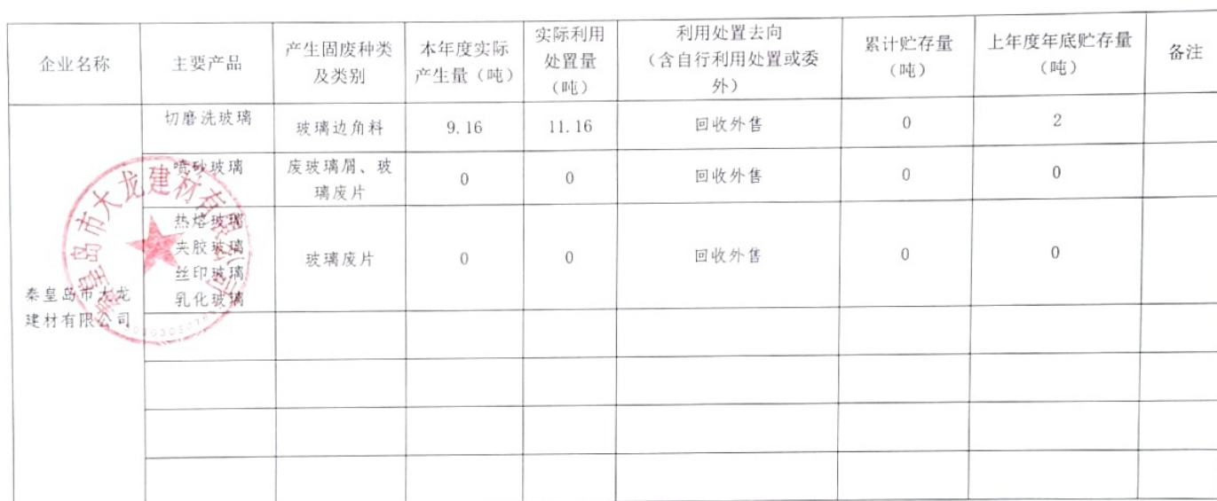
秦皇岛市一般固体废物产生单位信息公开模板（2021 年 1-12 月）

注：1. 可依据企业实际生产情况、工艺特点适当调整表格或增加文字描述。 2. 需要加盖企业公章。